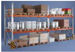
Palettenregale META MULTIPAL®