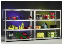
Weitspannregale META SPEED-RACK®