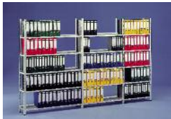
Büroregale META COMPACT®