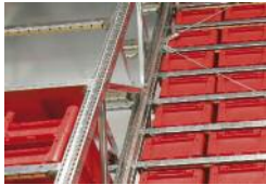
Steckregale META HIGH-CLIP®