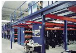
Stahlbausystembühnen & Fachmarkteinrichtungen