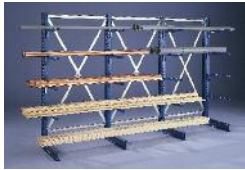
Kragarmregale META MULTISTRONG®