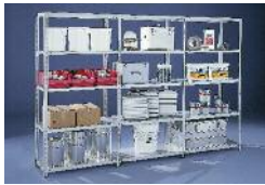
Fachbodenregale Schraubregale META FIX® Steckregale META CLIP®