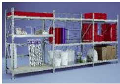
Weitspannregale META MINI-RACK®